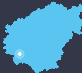
Brive-la-Gaillarde en Corrèze