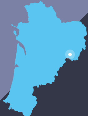
Brive-la-Gaillarde en Nouvelle Aquitaine